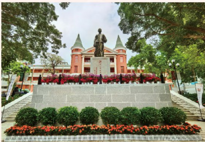
封底图片/中山大学广州校区