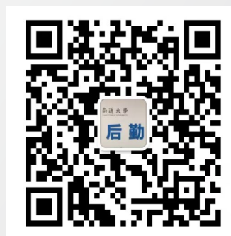
南通大学微后勤二维码